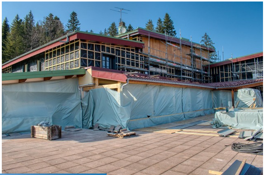
Isolation de la façade