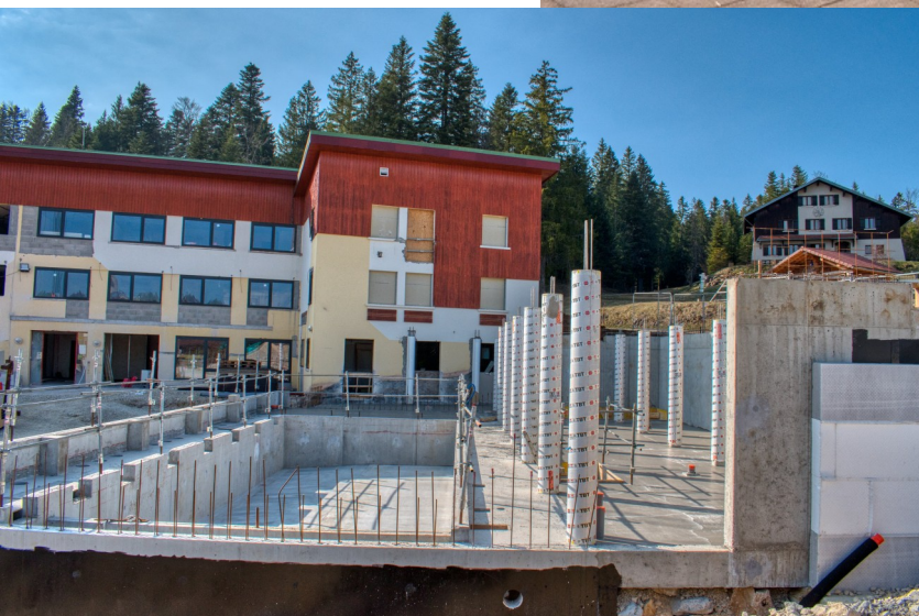
Espace de la piscine intérieure