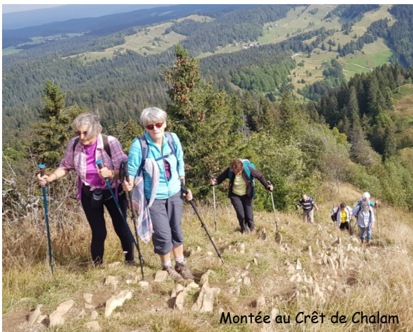
Montée au Crêt de Chalam

Si vous êtes tentés de nous rejoindre pour parcourir sentiers et chemins jurassiens en toute convivialité et sans souci de performance, n'hésitez pas à me contacter au 06 77 21 34 17